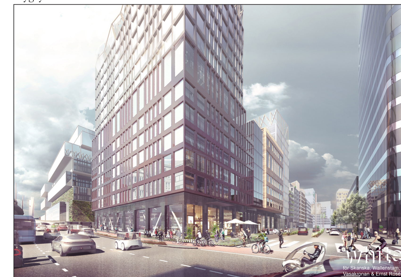
Planområdet sett från korsningen Södra Sjöfarten/Stadstjänaregatan. Nya Regionens hus till höger och Hisingsbron till vänster i bild