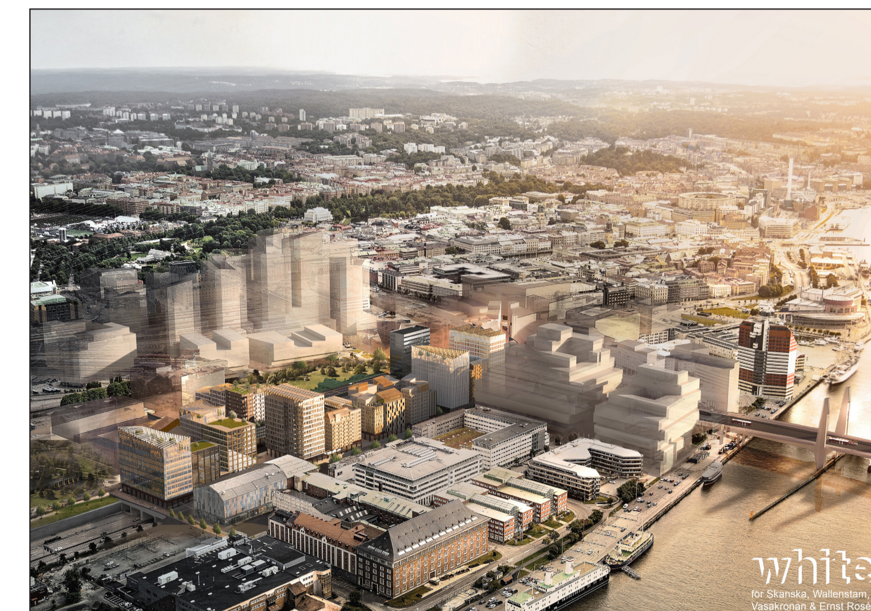
Flygvy sett från nordöst